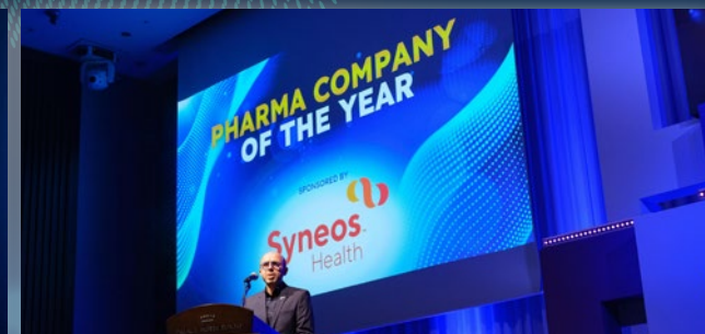
ソーシャルメディア スポンサーシップ