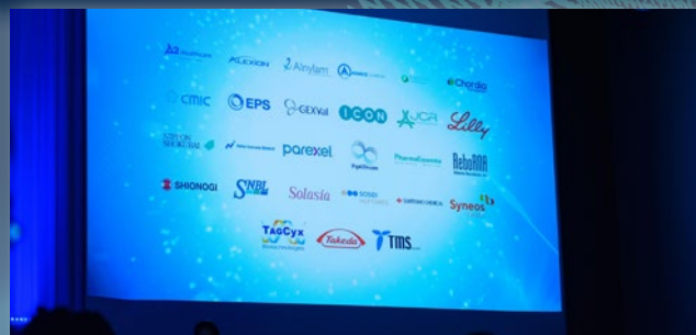
カテゴリー スポンサーシップ*