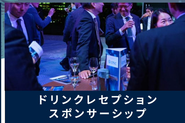
ドリンクレセプション スポンサーシップ

★ご要望に個別に対応するビスポーク型スポンサーシップもご提供可能です。お気軽にご相談下さい。