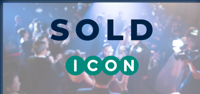
ヘッドライン スポンサーシップ