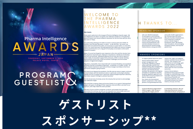
ゲストリスト スポンサーシップ**